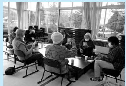
＜サロン活動への助成＞