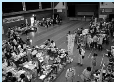
＜福祉バザーの開催＞