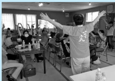
＜一人暮らし高齢者交流事業＞