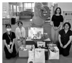
遠野市保育協会 様