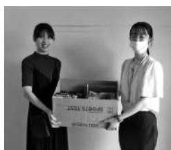
遠野東中学校 PTA 様