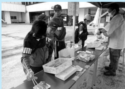
＜わらすっこまつりへの助成＞