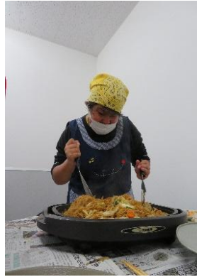
真剣な顔の料理人